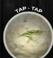
ТАР - ТАР